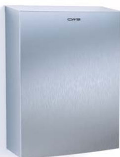
Box hygiénique Inox, 12L, Numéro d'article: 7753000

Couvercle ouvrant facilement | ouverture du couvercle après un léger contact seulement | support invisible à l'intérieur pour insérer les sacs poubelle | convient aussi aux petites cabines de toilette grâce à sa faible profondeur | volume d'env. 12 litres | fixation facile au mur