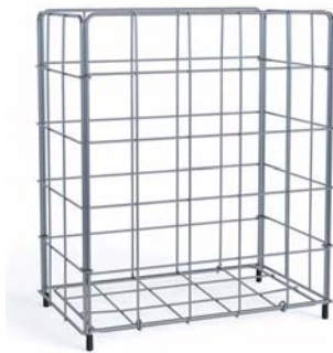
Corbeille à papier en inox, 25l, No. 752000 Fixation pour corbeille à papier, No. 300301000

Treillis en inox | brossé mat | pieds plastiques noirs | posée au sol ou fixée au mur | pliable | volume de 25 litres environ