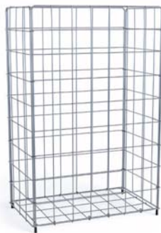
Corbeille à papier en inox, 60l, No. 750000 Fixation pour corbeille à papier, No. 300301000

Treillis en inox | brossé mat | pieds plastiques noirs | posée au sol ou fixée au mur | pliable | volume de 60 litres environ