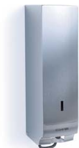
Distributeur de savon crème Inox Numéro d'article: 7001000

«Clickin-Bottle-System» (remplacement très rapide du flacon de savon) | indicateur de niveau facilitant le service | la composition des savons correspond aux directives européennes relatives aux produits cosmétiques et leur tolérance cutanée a été confirmée par des tests dermatologiques | utilisation ergonomique à une main | 1 flacon (1.000 ml) = env. 1.600 portions | récipient de réserve = env. 160 portions | avec serrure de sécurité antivol