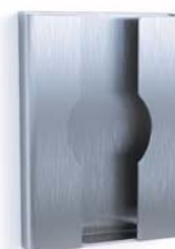
Support de sachets hygiéniques Inox (pour sachets polyéthylène) Numéro d'article: 7756000

Support de sachets hygiéniques (sachets polyéthylène) Fixation au mur avec de la colle, pas de perçage requis | apposition possible sur les boxes hygiéniques de CWS