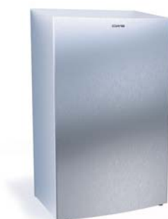
Récipients à déchets Inox, 40L, Numéro d'article: 7751000 Numéro d'article Couvercle, 40L: 307751000 Numéro d'article Cadre, 40L: 307751100

Grande ouverture | support invisible à l'intérieur pour insérer les sacs poubelle | facultatif: avec couvercle basculant | couvercle servant d'élément pare-vue | unité de couvercle non saillant | prélèvement facile du sac poubelle grâce au couvercle amovible pouvant être posé au moyen d'un système d'encliquetage spécial | volume d'env. 40 litres | pieds plastiques noirs | pose au sol ou fixation au mur