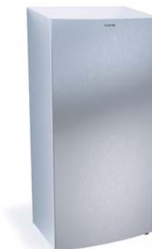
Récipients à déchets Inox, 60L, Numéro d'article: 7750000 Numéro d'article Couvercle, 60L: 307750000 Numéro d'article Cadre, 60L: 307750100

Grande ouverture | support invisible à l'intérieur pour insérer les sacs poubelle | facultatif: avec couvercle basculant | couvercle servant d'élément pare-vue | unité de couvercle non saillant | prélèvement facile du sac poubelle grâce au couvercle amovible pouvant être posé au moyen d'un système d'encliquetage spécial | volume d'env. 40 litres | pieds plastiques noirs | pose au sol ou fixation au mur