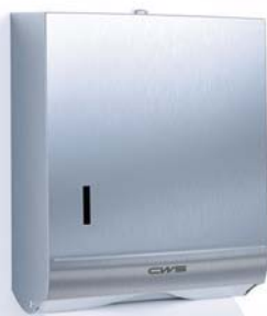
Distributeur de serviettes en papier pliées Inox Numéro d'article: 7622000

Distributeur de serviettes en papier pliées adapté aux serviettes pliées en C, V, Z, CZ ou W-Interfold | retrait facile des serviettes en papier individuelle | indicateur de niveau à fenêtre | capacité pour environ 300 serviettes en papier pliées | avec serrure de sécurité antivol