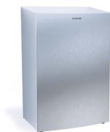
Récipients à déchets Inox, 25L, Numéro d'article: 7752000 Numéro d'article Couvercle, 25L: 307752000 Numéro d'article Cadre, 25L: 307752100

Grande ouverture | support invisible à l'intérieur pour insérer les sacs poubelle | facultatif: avec couvercle basculant | couvercle servant d'élément pare-vue | unité de couvercle non saillant | prélèvement facile du sac poubelle grâce au couvercle amovible pouvant être posé au moyen d'un système d'encliquetage spécial | volume d'env. 25 litres | pieds plastiques noirs | pose au sol ou fixation au mur