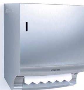
Distributeur de portions de papier prédécoupées Inox Numéro d'article: 7205000

Chaque utilisateur n'entre en contact qu'avec sa propre portion de papier (système mécanique Non-Touch) | La portion est personnelle et distribuée grâce à un mécanisme de découpage automatique | Recharge facile du nouveau rouleau papier grâce au système breveté Easy-Loading-System | Fonctionne sans électricité ni piles