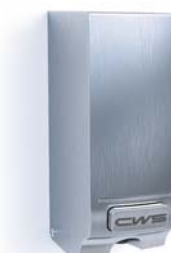
Nettoyage manuel de la lunette de WC Inox Numéro d'article: 7567000

Nettoyage et décontamination hygiéniques, manuels, de la surface* du siège WC | utilisation facile et distribution du spray sans goutter | répond aux critères selon EN 1276 (effet bactéricide) et EN 13697 (effet bactéricide et levuricide) | certification du liquide conformément à VAH | liquide nettoyant séchant rapidement | bouton-poussoir pour un dosage précis | élimination peu encombrante des sachets vides | env. 1'500 portions de spray par sachet de 300 ml