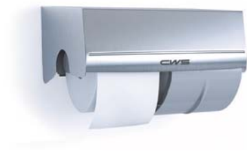
Distributeur de papier hygiénique Inox Numéro d'article: 7604000

Distributeur compact pour des fréquences d'utilisation faibles à moyennes | utilisation de rouleaux de papier hygiénique standards | système à deux chambres – rouleau de réserve compris et protégé à l'intérieur du distributeur | libération du rouleau de réserve après la fin du premier rouleau | détachement facile de la portion | convient à tous les papiers standards de CWS-boco | papier hygiénique à base de papier recyclé, etc. disponible | frein de rouleau intégré – pour une consommation économique | avec serrure de sécurité antivol