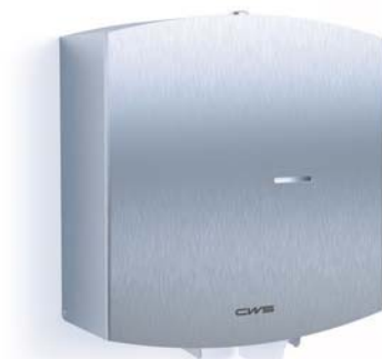
Distributeur de papier hygiénique Inox Numéro d'article: 7630000 carrousel pour 4 rouleaux standards Numéro d'article: 307630000

Distributeur de papier hygiénique pour rouleaux jumbo ou petits rouleaux, destiné aux locaux sanitaires très fréquentés | travail de recharge significativement réduit | indicateur de niveau à fenêtre | coupe-papier utilisable des deux côtés | recharge simple et sûr grâce au couvercle rabattable avec sécurité antichute | possibilité d'utiliser 1 rouleau jumbo ou 4 petits rouleaux (carrousel 4 rouleaux) | distribution économique grâce au frein de rouleau intégré | serrure de sécurité antivol